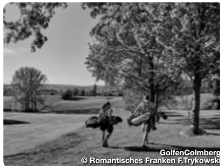
Golfen Colmburg

Mit gleich sechs Golfplätzen ist die Auswahl vor den Toren von Nürnberg groß. Allesamt liegen sie schön eingebettet in die Landschaft und haben noch viel Platz für Gastspieler. Auf den vier 18-Loch und zwei 9-Loch Anlagen kann man entspannte Runden genießen.