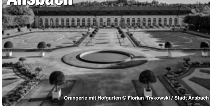
Orangerie mit Hofgarten

Der Hofgarten südöstlich der Residenz ist im französisch-barocken Stil gehalten. Die Anfänge des Gartens reichen in das 16. Jahrhundert zurück. Der Leonhart-Fuchs-Garten ist dem ehemaligen Leibarzt des Markgrafen und „Vater der Botanik“ Leonhart Fuchs gewidmet. Außerdem erinnert im Hofgarten ein Gedenkstein an die Stelle des Attentats auf Kaspar Hauser, dem berühmtesten Findelkind der Geschichte. Architektonischer Mittelpunkt des Hofgartens ist die schlossartige Orangerie, die 1726 bis 1728 von Carl Friedrich von Zocha nach französischen Vorbildern errichtet wurde. Promenade 33, Ansbach