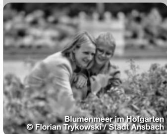
Blumenmeer im Hofgarten

Der Hofgarten südöstlich der Residenz ist im französisch-barocken Stil gehalten. Die Anfänge des Gartens reichen in das 16. Jahrhundert zurück. Der Leonhart-Fuchs-Garten ist dem ehemaligen Leibarzt des Markgrafen und „Vater der Botanik“ Leonhart Fuchs gewidmet. Außerdem erinnert im Hofgarten ein Gedenkstein an die Stelle des Attentats auf Kaspar Hauser, dem berühmtesten Findelkind der Geschichte. Architektonischer Mittelpunkt des Hofgartens ist die schlossartige Orangerie, die 1726 bis 1728 von Carl Friedrich von Zocha nach französischen Vorbildern errichtet wurde. Promenade 33, Ansbach