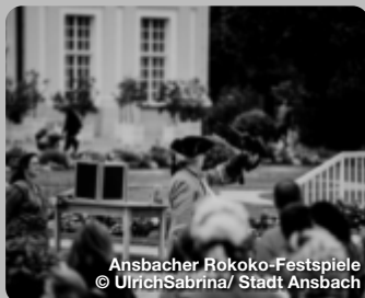
Ansbacher Rokoko-Festspiele