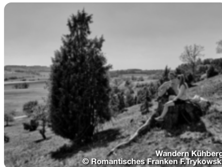
Wandern Kühberg

Ein großes Netz an Wanderwegen durchzieht den Naturpark Frankenhöhe. Rund um den Hesselberg kann man mit herrlicher Aussicht wandern. Rund um die historischen Städte von Dinkelsbühl, Feuchtwangen und Rothenburg o.d.T. stehen eigene Wegenetze bereit. Mit Geschichte wandern geht man auf dem KulturWanderweg Hohenzollern zwischen Rosstal und Langenzenn. Bei Stein und Zirndorf ist der Wanderweg Wallensteins Lager eine schöne Mischung aus Naturerlebnis und Geschichtspfad.