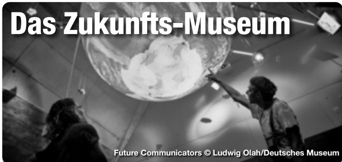
Future Communicators

Zukunft zum Anfassen. Im Deutschen Museum Nürnberg wartet schon heute die Welt von morgen Wie werden wir in 10, 20 oder 50 Jahren leben? Wie entwickelt sich Technik weiter - und vor welche Herausforderungen stellt uns das als Gesellschaft? Was wünschen wir uns? Welche Befürchtungen haben wir? Die Zweigstelle des Deutschen Museums im Herzen der Nürnberger Altstadt lädt zu einem spannenden und aufschlussreichen Blick in die Zukunft ein. Die Grundkonzeption einer Gegenüberstellung von „Science“ und „Fiction“ zieht sich dabei als roter Faden durch alle Bereiche der Ausstellung. Hier werden konkrete Projekte aus der aktuellen Forschung vorgestellt, die vielleicht schon morgen unser Leben beeinflussen könnten.