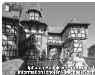
Iphofen Rödelseer Tor