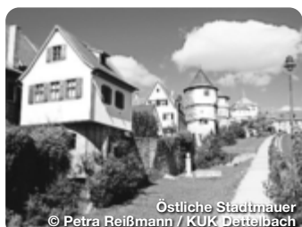
Östliche Stadtmauer