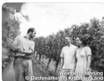
Weinbergsführung © Dachmarketing Kitzinger Land