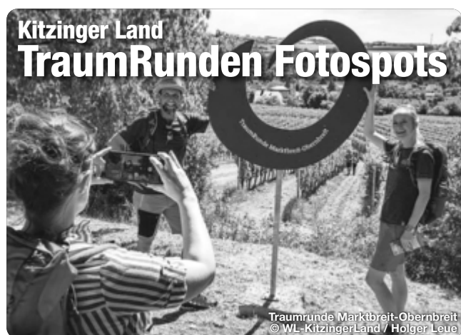
Traumrunde Marktbreit-Obernreit

Die Weinstadt ist das Zentrum der Mainschleife und hat eine über 1.100jährige Ortsgeschichte, ganz im Zeichen des Frankenweins, vorzuweisen. TreffpunktDeutschland.de/volkach