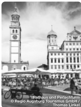
Rathaus und Perlachturm