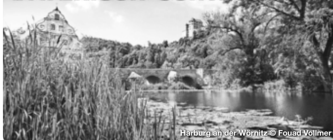
Harburg an der Wörnitz

Die Ausflugs- und Kurzurlaubsregion Bayerisch-Schwaben erstreckt sich vom Nördlinger Ries über das Schwäbische Donautal, die Fuggerstadt Augsburg und das LEGOLAND® bis ins Wittelsbacher Land. Radwege in idyllischen Flusslandschaften sowie Wander- und Themenwege durch die vielfältige Natur machen die Region zu einem beliebten Ziel für große und kleine Aktivurlauber. Zwischen prächtig-glanzvoll und verträumt-gemütlich präsentieren sich die Städte und Orte Bayerisch-Schwabens. Entlang der Romantischen Straße lassen sich viele Highlights verknüpfen. Kulturfans und Familien genießen das besondere Flair der historischen Stadtkulissen, Burgen und Straßenzüge, begeben sich auf die Spuren von Römern, Fuggern & Co. TreffpunktDeutschland.de/bayerisch-schwaben