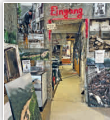
... die außer vielen Bildern auch mehrere Filmsequenzen beinhaltet.

AHRTAL. AFi. Auch fast zwei Jahre nach der verheerenden Flut ist das Ausmaß der Schäden entlang der Ahr weiterhin gegenwärtig. An vielen Stellen sieht es auf den ersten Blick noch immer nicht danach aus – doch es geht voran. Inhaber von Hotels, Restaurants und Geschäften haben, samt ihrer Mitarbeiter*innen, unzählige Stunden Arbeit, verbunden mit viel Hoffnung und Mut, in den Wiederaufbau ihrer geschäftlichen Existenzen gesteckt. Das Ziel: Endlich wieder zahlreiche Tages- und Übernachtungsgäste sowie Kundinnen und Kunden begrüßen zu können. Wanderfreudige Besucher*innen des Ahrtals dürfen sich, neben unvergesslichen Stunden in grandioser Natur entlang