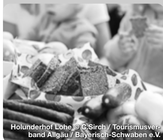
Hollenhof Lohe

Die Ausflugs- und Kurzurlaubsregion Bayerisch-Schwaben erstreckt sich vom Nördlinger Ries über das Schwäbische Donautal, die Fuggerstadt Augsburg und das LEGOLAND® bis ins Wittelsbacher Land. Radwege in idyllischen Flusslandschaften sowie Wander- und Themenwege durch die vielfältige Natur machen die Region zu einem beliebten Ziel für große und kleine Aktivurlauber. Zwischen prächtig-glanzvoll und verträumt-gemütlich präsentieren sich die Städte und Orte Bayerisch-Schwabens. Entlang der Romantischen Straße lassen sich viele Highlights verknüpfen. Kulturfans und Familien genießen das besondere Flair der historischen Stadtkulissen, Burgen und Straßenzüge, begeben sich auf die Spuren von Römern, Fuggern & Co. TreffpunktDeutschland.de/bayerisch-schwaben